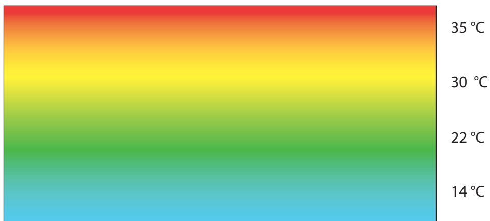
SENZA L'USO DEI DESTRATIFICATORI

Nei capannoni industriali un'enorme quantità di energia termica spesso è sprecata per riscaldare anche la parte superiore dei locali, in genere inutilizzata. Se la coibentazione del soffitto è poi imperfetta, la dispersione del calore verso l'esterno aumenta ancora di più. L'aria riscaldata dai comuni generatori di calore e da eventuali fonti tecnologiche calde, sale per modo convettivo naturale verso l'alto, stratificando al di sotto del soffitto, attraverso il quale si disperde gradualmente. Si è riscontrato, infatti che in un ambiente standard alto 7 metri per ottenere una temperatura di 19°C ad altezza uomo, è necessario far funzionare gli apparecchi riscaldanti fino a creare sotto il soffitto uno strato di aria calda di circa 31°C. Per raggiungere questo risultato occorre riscaldare l'intero volume del locale con una temperatura media di 25°C. Nei casi di coibentazione carente della copertura, il fenomeno della stratificazione sembra meno evidente perché il calore si disperde all'esterno, con sprechi ancora più evidenti di energia termica, e costi superiori alle effettive necessità. Occorre quindi impedire l'accumulo di calore e la sua dispersione nella zona alta dello stabile, con un ricircolo costante dell'aria nell'ambiente.